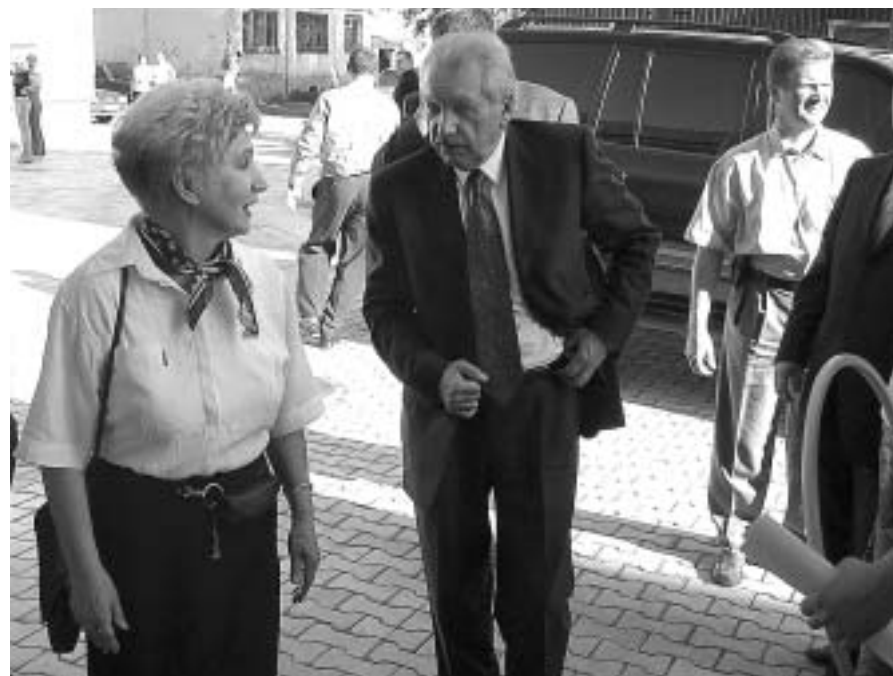
Глава РК был немного удивлен тем, что его не дождались.

Во время футбольного матча ничего страшного не случилось. Г-н Ольшевский вышел во втором тайме. Голов он не забил, но его команда все равно довольно легко победила.