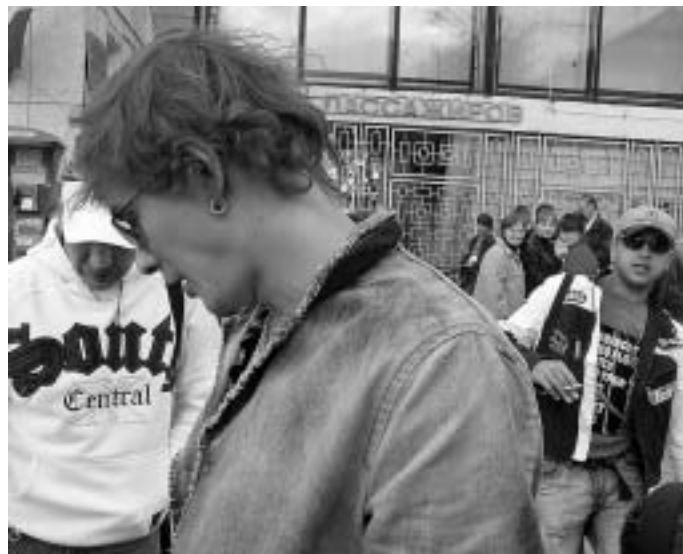
Группа «Отпетые мошенники» высадились в сыктывкарском аэропорту в воскресенье, в пять часов вечера.

Организаторы концерта, который должен был венчать День города вечером 13 июня, заблаговременно договорились с гостиницей «Сыктывкар» на обслуживание группы «Отпетые мошенники» по полной программе. Алкоголя артисты не заказывали, попросив, по информации «ЗЖ», устроителей найти им адекватный заменитель. По данным «ЗЖ», в райдере «мошенников» значилась и туалетная бумага, рулоны которой во время концерта должны были, разматываясь сер-