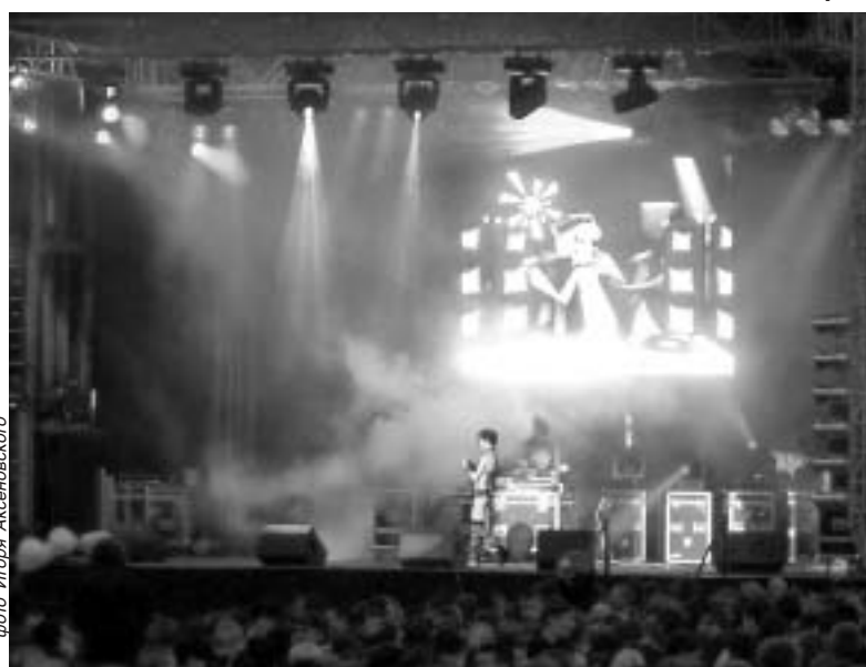
Сыктывкарская публика впервые познакомилась с технологией виртуального ди-джея.