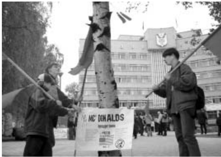
В рамках акции КПРФ молодые коммунисты протестовали также против закусокных «Макдональдса».