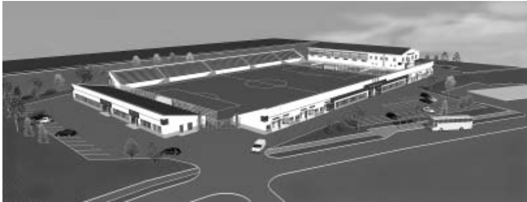
Футбольный спорткомплекс существует пока только в виде эскиза