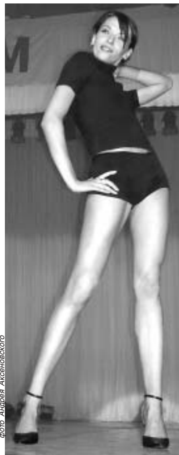
У мисс «Фуджи» с параметрами все в порядке: 89-61-90.

Титул «Мисс Фуджи-фильм» в итоге достался 21-летней студен-